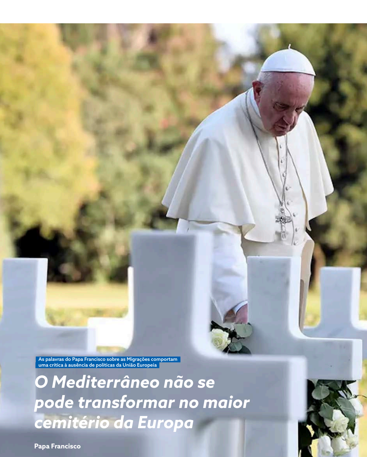
As palavras do Papa Francisco sobre as Migrações comportam uma crítica à ausência de políticas da União Europeia

O objetivo da União Europeia para 2030 relativamente às competências é de ter, no mínimo, 60% da população adulta a participar anualmente em ações de formação.