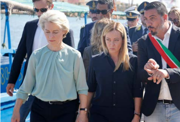
“A migração irregular é um problema europeu que precisa de uma resposta europeia” disse Ursula Von der Leyen.

o Parlamento Europeu assumiu um importante papel enquanto impulsor da revisão sobre a Gestão do Asilo e das Migrações